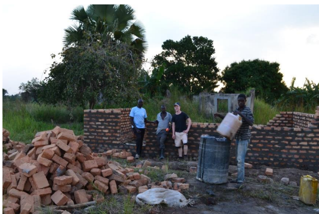
De bouw in 2013

Arts Internationale Gezondheidszorg en Tropengeneeskunde