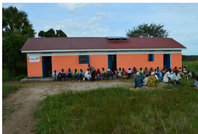
Het Health Centre in 2016