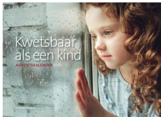
Adventskalender 2017 verkrijgbaar in de Boekspot

A.s. zondag zijn we niet alleen 's morgens na de ochtenddienst vertegenwoordigd met de boekentafel, ook 's middags bij de Klierderkerk zijn we er met extra veel leuke kinderboekjes, kinder doeboekjes, uitgaven voor advent, kerst, enz. Tip: leuk om alvast in te slaan voor Sinterklaas ;-)